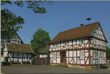
Museum Gensungen mit Backhaus

Die AG bietet jeden 1. Samstag im Monat nach Voranmeldung geführte Wanderungen auf den archäologischen Pfaden an.