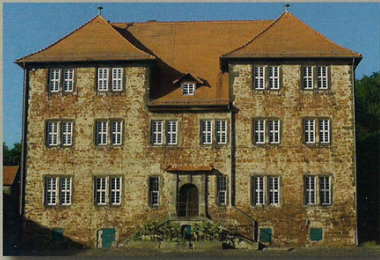
Herrenhaus des Mittelhofs

Dabei schweift der Blick über die Domäne Mittelhof, die Landgraf Moritz Anfang des 17. Jh. erbauen ließ. Dort lebte Egbert Hayessen, der im Zusammenhang mit dem Attentat auf Hitler am 20. Juli 1944 hingerichtet wurde.