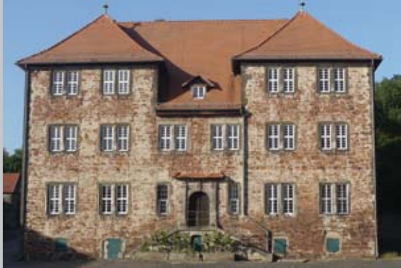
Herrenhaus des Mittelhofs

Dabei schweift der Blick über die Domäne Mittelhof, die Landgraf Moritz Anfang des 17. Jh. erbauen ließ. Dort lebte Egbert Hayessen, der im Zusammenhang mit dem Attentat auf Hitler am 20. Juli 1944 hingerichtet wurde.