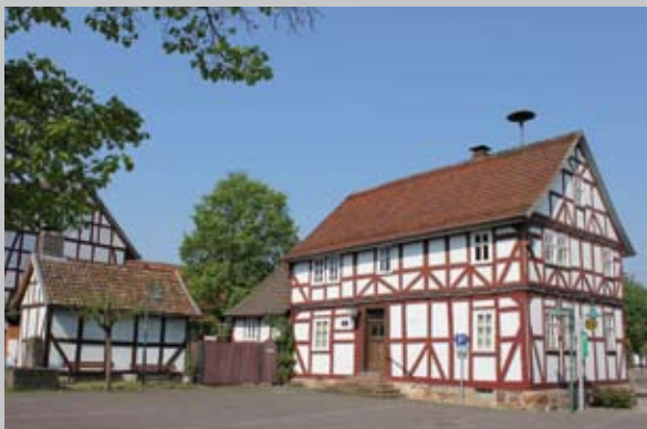
Museum Gensungen mit Backhaus

Die AG bietet jeden 1. Samstag im Monat nach Voranmeldung geführte Wanderungen auf den archäologischen Pfaden an.