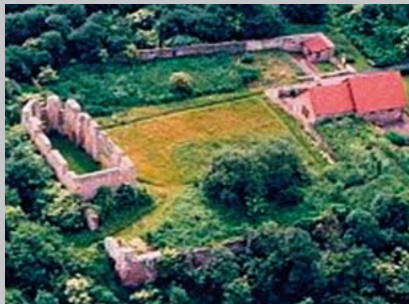
Kartause zu Eppenberg

Der Rückweg führt über die Ruinen von Stift und Kartause zu Eppenberg mit dem Bienenmuseum oberhalb der Ederau zurück nach Gensungen.