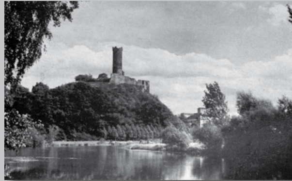
Altenburg an der Schwalmmündung

Wir werfen einen Blick auf die Altenburg, unterqueren den Bahndamm und gelangen zum Fundplatz des Schädels von Rhünda in der Nähe des Sportplatzes. Der Weg führt weiter östlich an der Schwalm entlang. Nach der Tafel 5 folgen wir einem Altarm und überqueren danach die Bundesstraße.