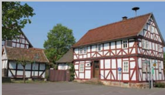
Museum Gensungen mit Backhaus

Die AG bietet jeden 1. Samstag im Monat nach Voranmeldung geführte Wanderungen auf den archäologischen Pfaden an.