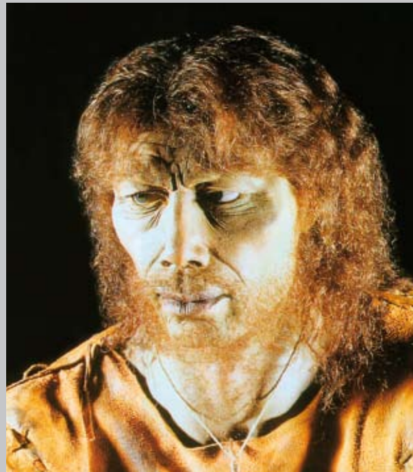
Rekonstruktion des Eiszeitjägers von Rhünda

Wir gelangen in den alten Ortskern von Rhünda. Anschließend erreichen wir nach einem leichten Anstieg die Hopfenberghütte, die zu einer Rast einlädt. Hier können wir unseren Blick weit über das Edertal schweifen lassen.