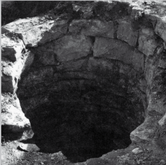
Frühmittelalterlicher Brunnen St. Alban, inzwischen überbaut

Ausgeruht wandern wir zurück nach Gensungen. Im Ort kommen wir zur ehemaligen Siedlung St. Alban.